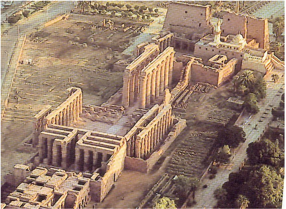
IMAGEN 6 Templo de .....